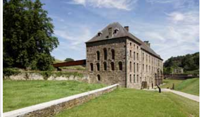
Rénovation du Moulin de Villers-la-Ville, Binario