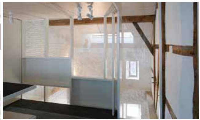
Rénovation du Moulin de la Paix Dieu, Binario

UNE ORGANISATION DE LA MAISON DE L'URBANISME FAMENNE-ARDENNE, LA MAISON DE L'URBANISME LORRAINE-ARDENNE ET DE LA CELLULE « DÉVELOPPEMENT DURABLE » DE LA PROVINCE DE LUXEMBOURG