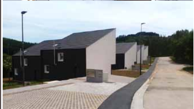
Construction de logements sociaux à Stavelot, Binario